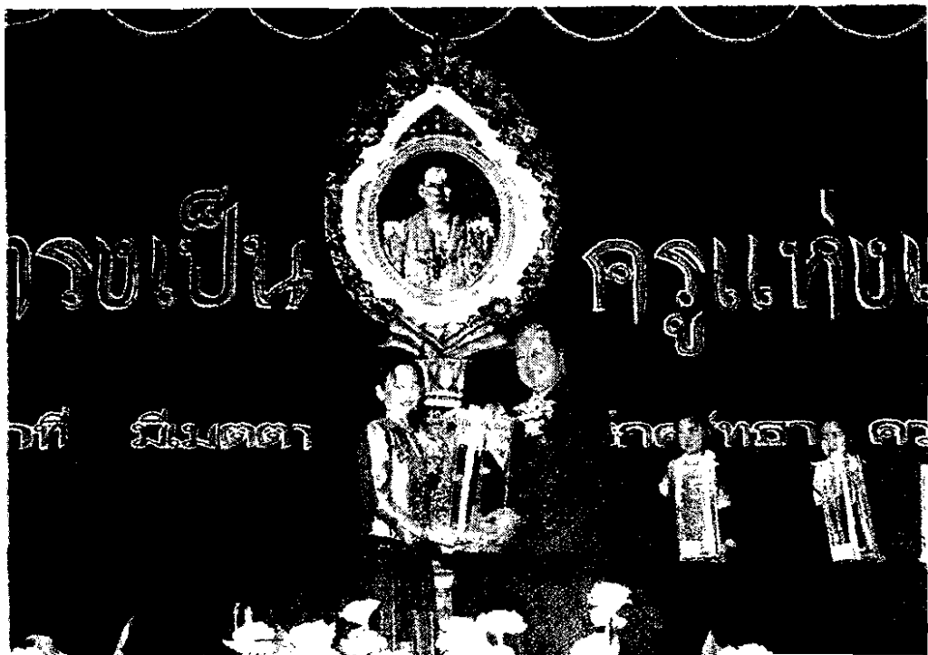
เชิดชูครูเกษียณ...ม.ร.ว.สุขุมพันธุ์ บริพัตร ผู้ว่าฯกทม. เป็นประธานในงานเชิดชูเกียรติครูเกษียณ ประจำปี 2555 พร้อมมอบโล่ให้แก่ครูผู้เกษียณอายุราชการ เพื่อเชิดชูเกียรติและตอบแทนบุญคุณ สำหรับผู้ที่ทำหน้าที่สั่งสอนลูกศิษย์มาตลอดอายุราชการ เนื่องในวันครูแห่งชาติ ณ อาคารกีฬาเวสน์ 2 ศูนย์เยาวชนกทม. ไทย-ญี่ปุ่น ดินแดง