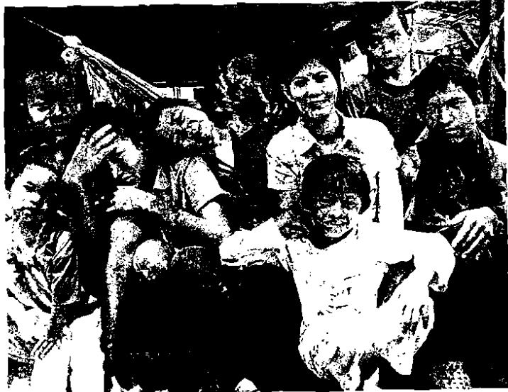
ครูเจียมกับเด็กๆ

โอกาสส่วนครูที่เพิ่งผ่านมา คนอาจเห็นภาพครูในมุมที่เราพบเจอได้ทั่วไป แต่ยังมีครูอีกกลุ่มหนึ่ง ซึ่งทุ่มเททำงานอย่างยากลำบากมากกว่าคนอื่น โดยไม่หวังสิ่งตอบแทนใดๆ โดยสำนักงานส่งเสริมสังคมแห่งการเรียนรู้และพัฒนาคุณภาพเยาวชน (สสค.) ได้นำเสนอครูจิตอาสาเพื่อเด็กเร่ร่อนและเด็กด้อยโอกาส ว่าที่ครูสอนดีตามโครงการสังคมไทยร่วมกันคืนครูดีให้ศิษย์ ขกย่อง เชิดชูครูสอนดี ทั้งในระบบและนอกระบบ หวังกระตุ้นให้สังคมไทยเห็นคุณค่าและความสำคัญของครู