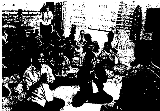
พ่อครูใช้ธรรมะสอน