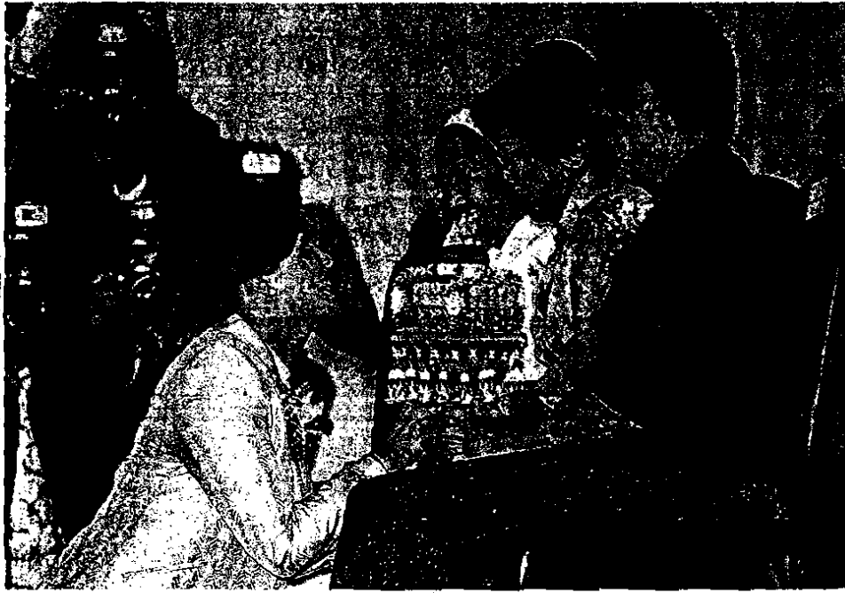
▲ พระตถครู น.ส.ยิ่งลักษณ์ ชินวัตร นายกรัฐมนตรี กราบอาจารย์ 3 ท่านที่เคยสอนตั้งแต่อนุบาลจนถึงชั้นมัธยมศึกษา เมื่อครั้งเรียนอยู่ที่โรงเรียนเรยีนาเชลีวิทยาลัย จ.เชียงใหม่ ในงานวันครูซึ่งจัดขึ้นที่หอประชุมครูสภา เมื่อเช้าวันที่ 16 ม.ค.