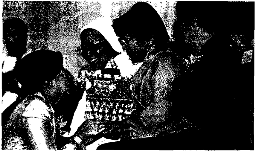
■ วันครู ■ น.ส.ยิ่งลักษณ์ ชินวัตร นายกรัฐมนตรี คารวะครูอาวุโสที่เคยสอนหนังสือ เพื่อแสดงความกตัญญูคุณครูที่ เนื่องในวันครูแห่งชาติ ที่หอประชุมครูสภา เมื่อวันที่ 16 ม.ค.

ครูได้ทุนระดับไฟ ทางเบี่ยงเสียงภัยพิบน นายกฯรับปากสงวน นายกฯ ย้ำทอมครู ย้ำรัฐบาลให้ความสำคัญพร้อมดูแลหนีสิน ขณะทศ. 3 จว. ได้ขอรัฐบาลไฟได้ ครูเชียงใหม่อ่อน ยกระดับชีวิตครู ฉบับเดือนนี้ 16