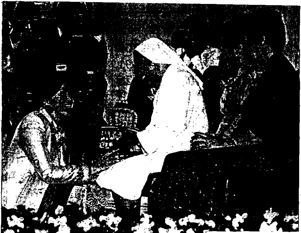
▲ ทั่วครู... สอนลักษณะ ชิน วิชา นายกรัฐมนตรี สอนระดับอนุบาล ระดับประถม ศึกษา และระดับมัธยมศึกษา เนื่องในงานวันครู โดยนายกรัฐมนตรี เผยว่ารัฐบาลจะดูแลขวัญกำลังใจ และสวัสดิการแก่ครูทุกคน

จัดงาน "วันครู" สุดยิ่งใหญ่ "ยิ่ง ลักษณ์" รุดเป็นประธานที่ครูสภา เทิดทูนในหลวงเป็นครูแห่งแผ่นดิน ดินโดยแท้จริง ย้ำวิชาชีพครูเสมือน ผู้ปิดทองหลังพระ ♦ อ่านต่อหน้า 15