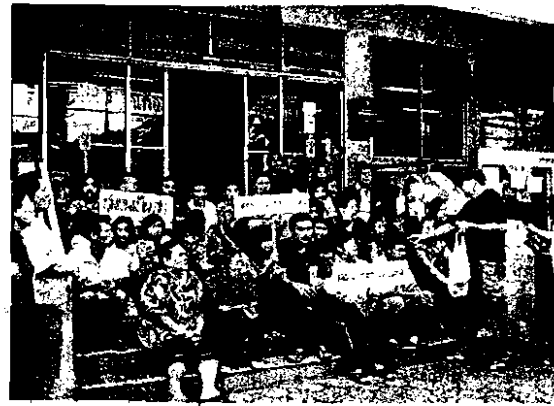
เด็กๆ ร่วมกิจกรรมกับชุมชน

ไหนผิด สิ่งไหนถูก ความจริง แล้วเด็กทุกคนมีพื้นฐานจิตใจที่ดี แต่ปัญหาที่เกิดขึ้นกับเด็กมาจาก การกระทำและสิ่งสมของผู้ใหญ่ ดังนั้น แทนที่จะไปไล่จับใจ เรา มาหาทางป้องกันไม่ให้มันเกิดดี กว่า เพราะเมื่อคุณภาพชีวิตคน ดีสังคมก็จะดี”