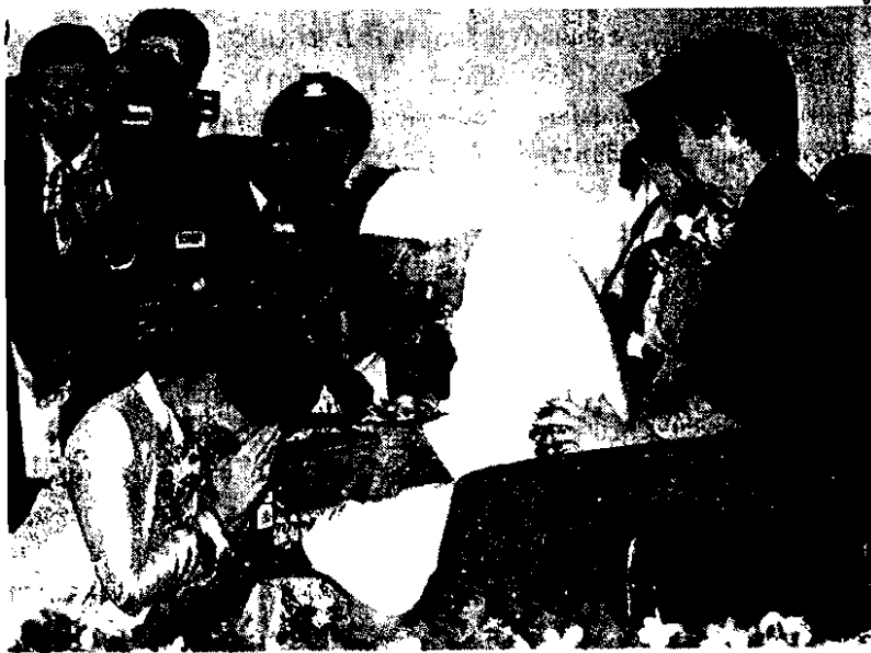
คารวะครู...น.ส.ยิ่งลักษณ์ ชินวัตร นายกรัฐมนตรี กำลังกราบครูอาวุโสที่เคยสอนในระดับอนุบาล ประถมศึกษาและมัธยมศึกษา เพื่อแสดงความมาตัญญูภาคภูมิใจ และน้อมรำลึกถึงพระคุณครู ในพิธีงาน วันครู ประจำปี 2555 ที่หอประชุมคุรุสภา สำนักงานเลขาธิการคุรุสภา กรุงเทพฯ